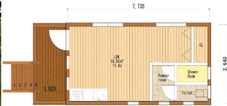
※空間イメージ/図基本プラン